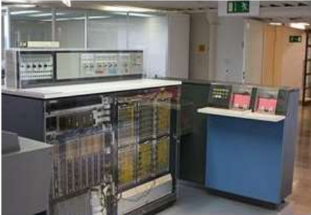
Рис. 1 IBM-360

В 1965 году начат выпуск семейства машин третьего поколения IBM-360 (США). Модели имели единую систему команд и отличались друг от друга объёмом оперативной памяти и производительностью.