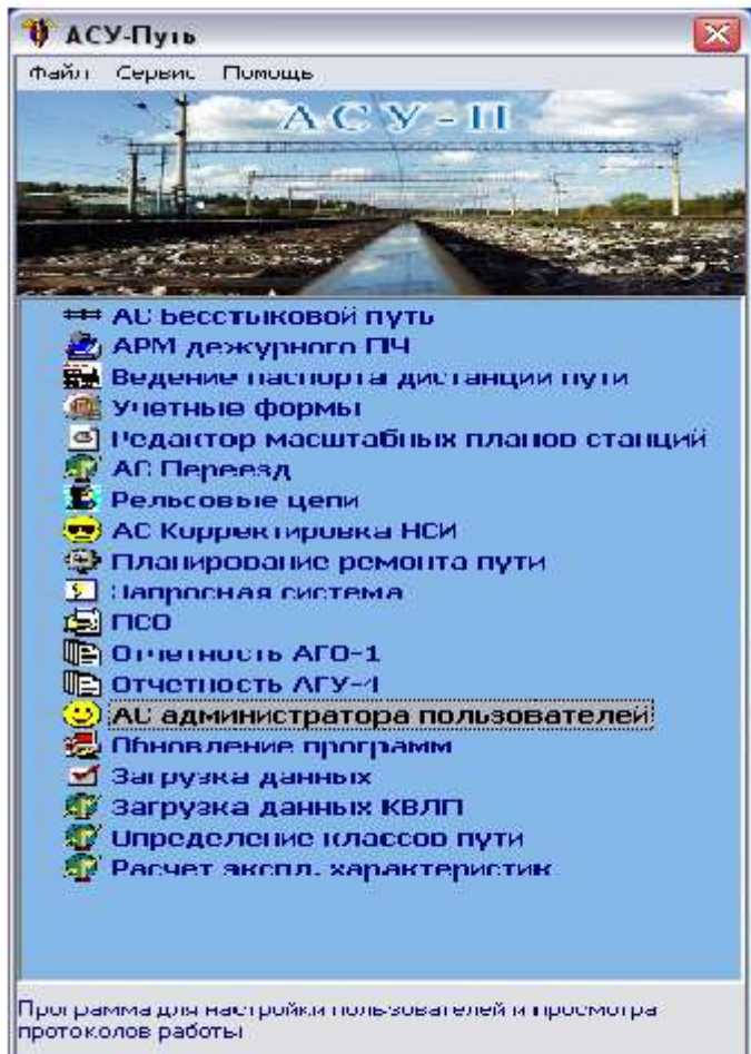
Рисунок 11. Главное меню АСУ - ПУТЬ

АСУ-ПУТЬ — многоуровневая система, охватывающая все составляющие путевого хозяйства. Она включает в себя несколько видов автоматизированных рабочих мест (АРМ), объединенных в локальную сеть предприятия и увязанных в глобальную сеть передачи данных на уровень дороги.