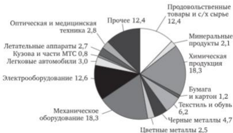
Рис. 7.2. Структура импорта РФ в 2018 г., % (по данным Министерства экономического развития 2 )