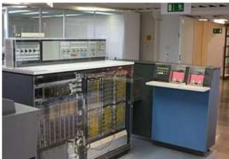
Рис. 1 IBM-360

В 1965 году начат выпуск семейства машин третьего поколения IBM-360 (США). Модели имели единую систему команд и отличались друг от друга объёмом оперативной памяти и производительностью.